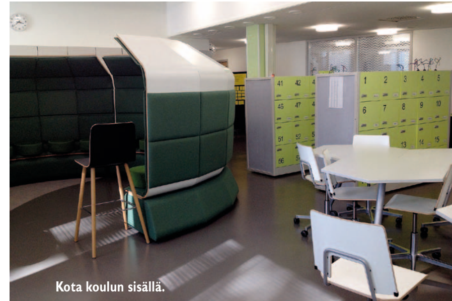
Kota koulun sisällä.